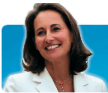
Ségolène Royal candidate à l'élection présidentielle